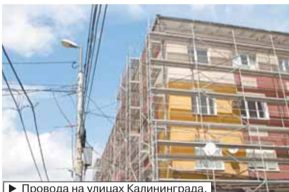
► Провода на улицах Калининграда.