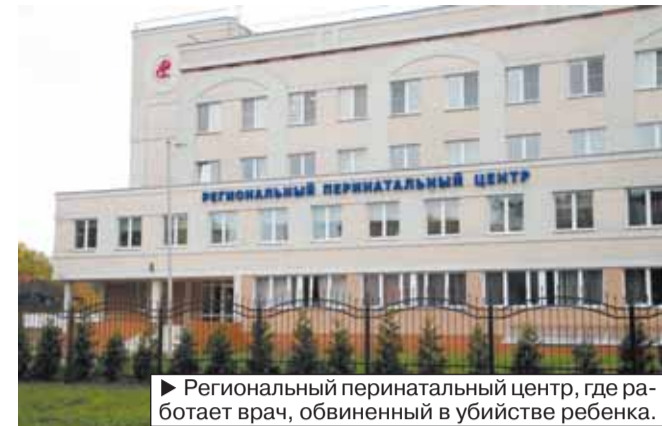
▶ Региональный перинатальный центр, где работает врач, обвиненный в убийстве ребенка.

Впервые калининградских докторов обвиняют в убийстве ребенка. Впервые профессиональное сообщество открыто выступило в их защиту и против подходов Следственного комитета.