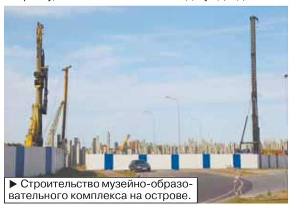
► Строительство музейно-образовательного комплекса на острове.