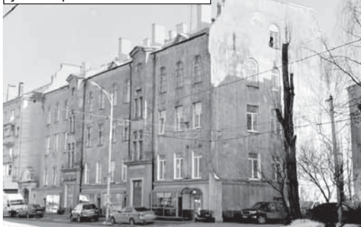
► Дом в Калининграде на ул. Багратиона в 2013 г.