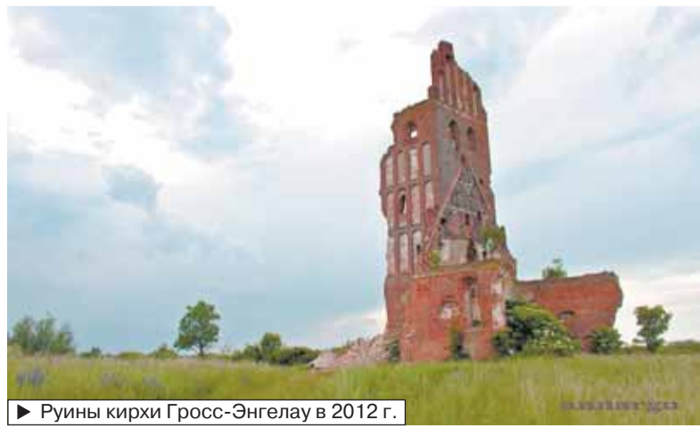
► Руины кирхи Гросс-Энгелау в 2012 г.