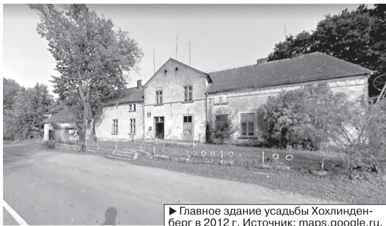
► Главное здание усадьбы Хохлинденберг в 2012 г.

наследия. Более подробно выяснить мотивы отказа на заседании совета не было возможности, так как решение по объекту выносилось без публичного обсуждения. Вероятно, причиной может служить и то, что в регионе пока не отработан механизм сохранения бывших усадеб. Непонятна их судьба и что с ними можно сделать в отсутствие серьезного ин-