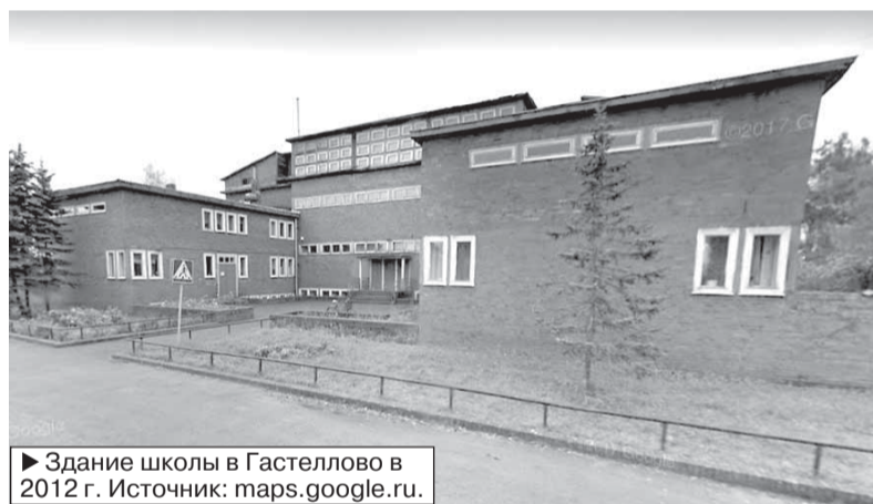
► Здание школы в Гастеллово в 2012 г.

впечатления об увиденном объекте в таком маленьком поселке, были просто поражены, какими архитектурными особенностями обладает здание школы в стиле баухаус.