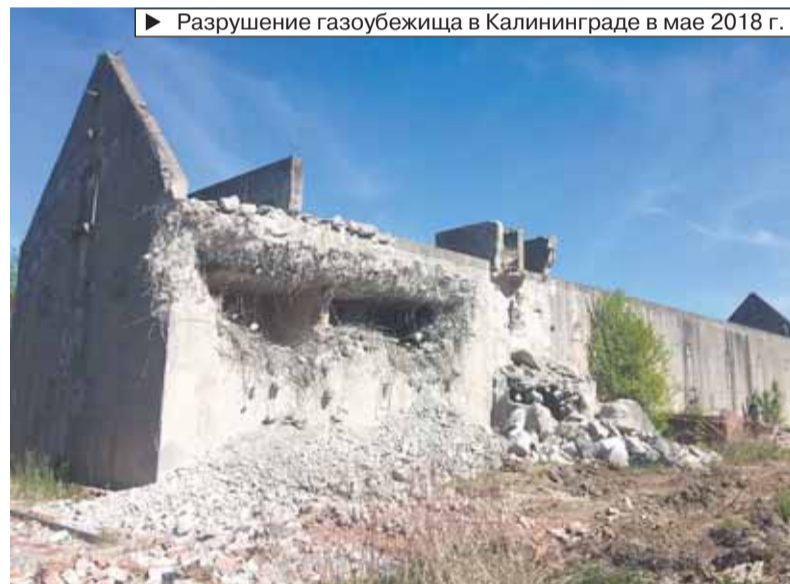
► Разрушение газозубежища в Калининграде в мае 2018 г.

имущественный комплекс. Вот такая логика у нас».