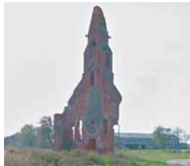
► Руины кирхи Кляйн Шёнау в 2012 г.

Шёнау] на 80%. Может быть, кусок башни, стена остались, – констатировал Маслов. – Ни одной и христианских конфессий оно не нужно, потому что оно для них не имеет историко-культурной ценности. Поговорите с представителями католической общины в Калининградской области. Для них это не ценность, а для нас должно быть ценностью? Очередная руина, которая на голову кому-то упадет? И никому, кстати, не принадлежит как