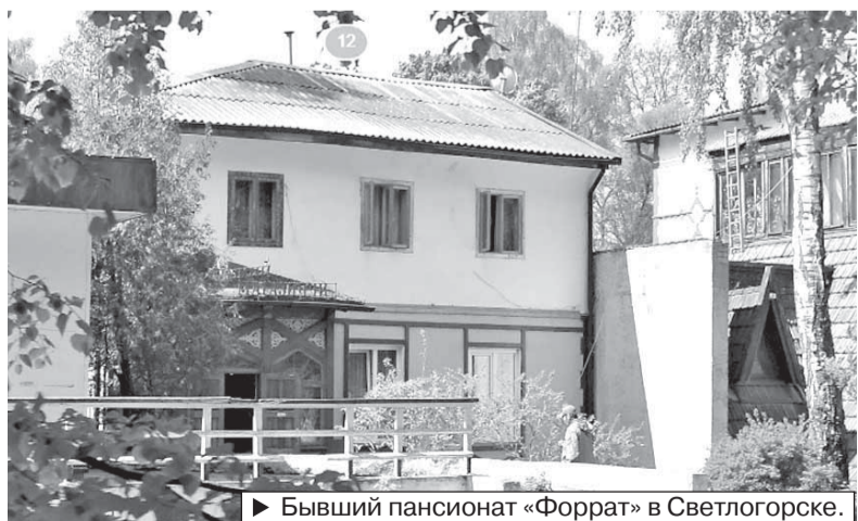
► Бывший пансионат «Форрат» в Светлогорске.

что служба опасается помешать дальнейшим планам властей по включению пустующего и разграбленного здания школы