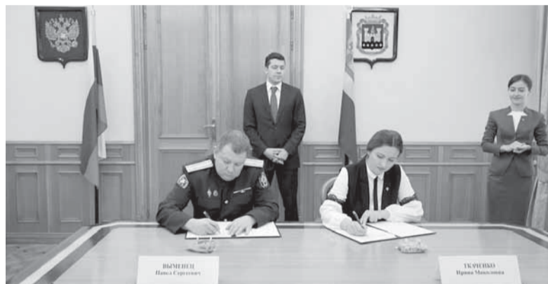
8 октября Калининград посетил новый руководитель Северо-Западного следственного управления на транспорте СКР (на фото сидит слева), а на следующий день появилось первое уголовное дело о хищениях при строительстве терминала в Пионерском.