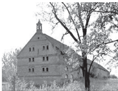
► Хозяйственная постройка усадьбы Хохлинденберг в 2012 г.

Отметим, что история, все достоинства и ценность усадебного дома вместе с огромным хозяйственным строением – 3-этажным комплексом, постро-