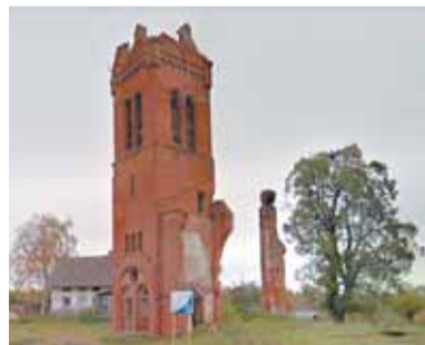
► Башня и остатки кирхи в Гросс-Фридрихсдорфе в 2012 г.

Похожая судьба у еще одной кирхи неподалеку, на том же военном полигоне Павенково. Это Гросс-Энгелау (Демьяновка в Правдинском районе). От нее