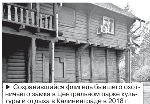
► Сохранившийся флигель бывшего охотничьего замка в Центральном парке культуры и отдыха в Калининграде в 2018 г.

что служба опасается помешать дальнейшим планам властей по включению пустующего и разграбленного здания школы