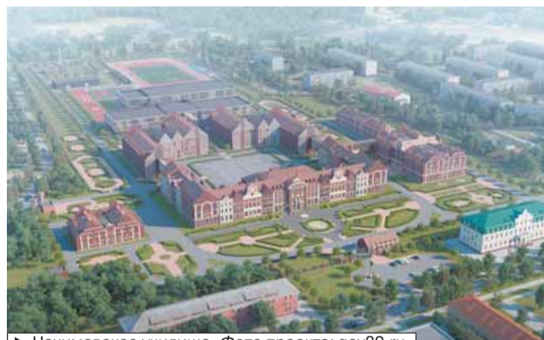
▶ Нахимовское училище.

«Мы собирали тысячи подписей, – снова голос из зала, – и отправляли в министерство здравоохранения, мы договаривались с Фондом социального строительства, что они могут выделить на первых эта-