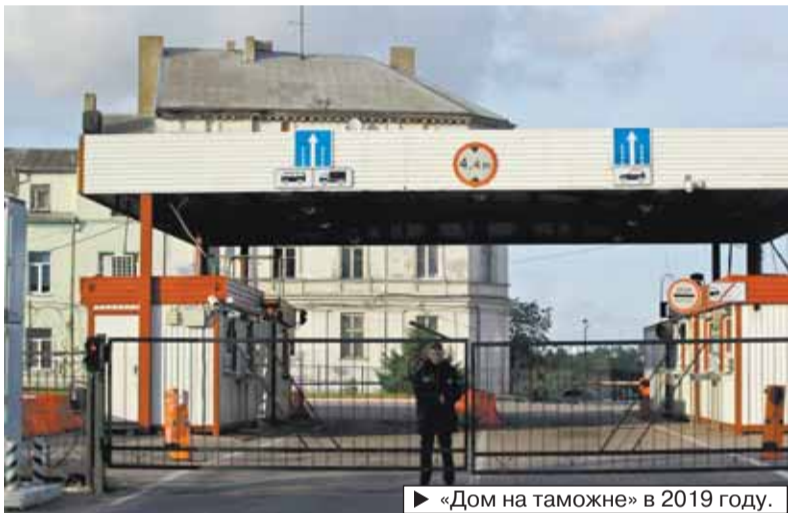
► «Дом на таможне» в 2019 году.

На месте убежища с мая 2018 года застройщик ООО «Бенефит-Запад» возводит 4-этажный жилой дом.