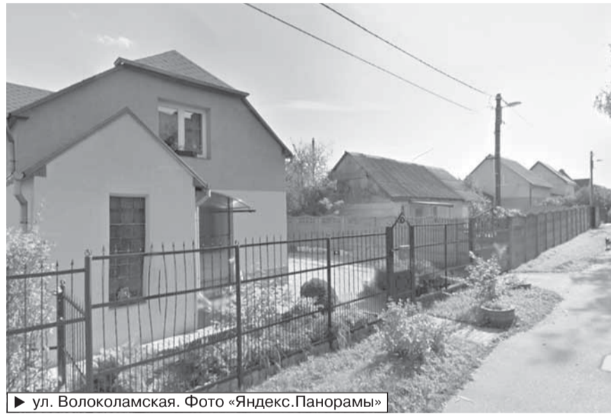
► ул. Волоколамская.

В границах СНТ «Пищевик» и «Железнодорожник» находят новые участки для строительства.